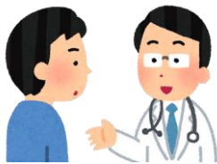
経営の早めの健康相談

経営の 早め の健康相談と考え、気をつける点を知り、改善したい習慣等の見直しに役立てます。