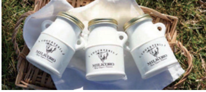
株式会社オオヤブデイリーファーム エイジングヨーグルト