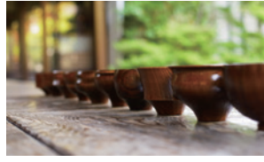
株式会社我戸幹男商店 山中漆器