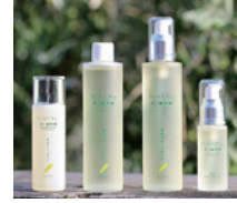
農業法人有限会社 井上誠耕園 美容オリーブオイル