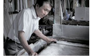
山梨県市川和紙・西嶋和紙 和紙や団扇・扇子などの クラフト体験