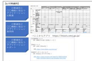
業務課題の見える化