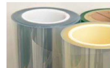
顧客ニーズに合わせて機能性フィルムの開発を行う

商談後は、大手企業に提示したサンプルに基づき詳細な打ち合わせを行いました。農業現場での実証実験を行い、取引が成約しました。