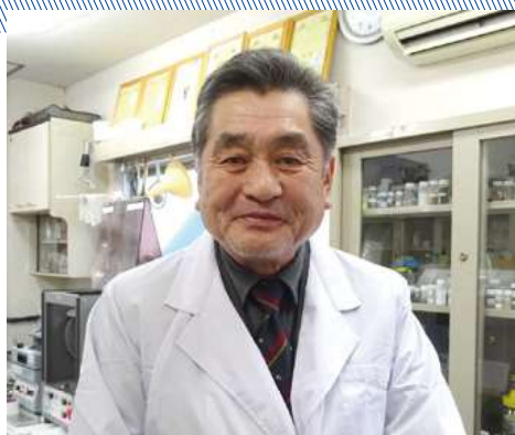
株式会社ナガオシステム 長尾代表取締役

材料混練装置技術について、大手企業の使用シーンがイメージできる提案を行い、大手企業の仕様や活用用途に合わせた実験を行うことで、大手化学メーカーと成約しました。