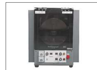
大手企業からの問い合わせが増えている粉砕、混練用途の3次元ボールミル