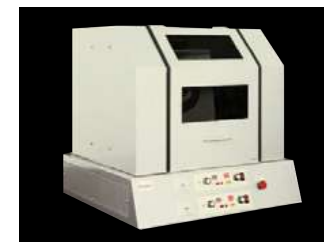
粉砕機、混練用途の3次元ボールミルを開発

商談後、大手企業が当社実験室を訪問し、「材料混練」の現場を確認しました。その後、打ち合わせを経て、取引が成約しました。同分野における共同開発も始動しました。