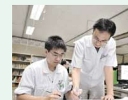
営業・技術一体となった課題解決

課題解決に向けて営業・技術それぞれの立場から意見交換を行い、最適な方法を検討する体制をつくっています。難しい案件でも、各部門に蓄積した知見を融合させることで課題解決につながることもあります。部門を越えたコミュニケーションの重要性を認識しています。