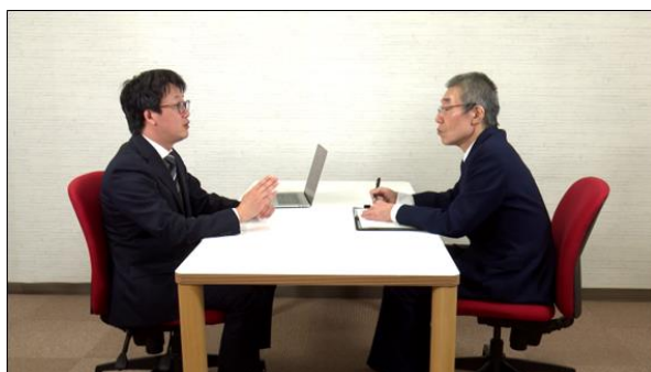
イメージしやすい実際の面談風景