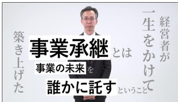
アドバイザーによる具体的な解説