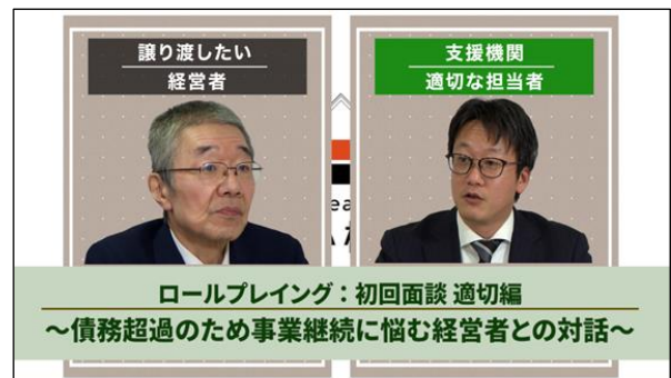
「不適切な事例」と「適切な事例」を対比