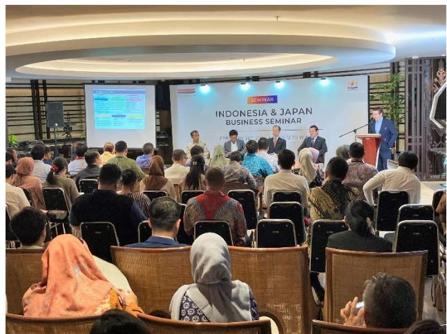
ビジネスセミナーの様子