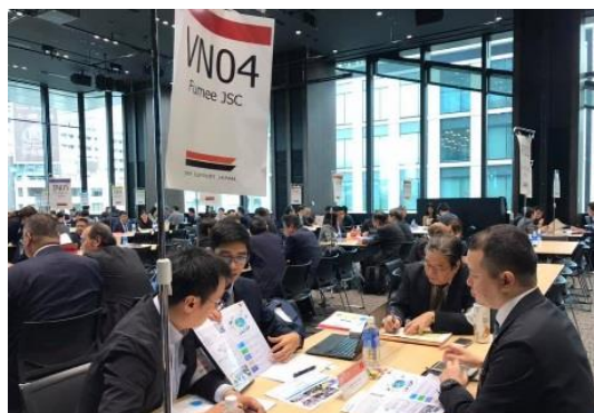
CEO 商談会風景 (令和元年10月開催)

本イベントでは、日本企業が有する精密加工技術や生産管理手法等に関心が高く、技術提携・連携などを希望するインドの企業経営者を招聘し、高い技術力を有する日本の中小企業との商談会を開催します。また、インド市場の最新市場情報や商習慣についてのセミナーも同時開催する予定です。