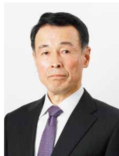
独立行政法人 中小企業基盤整備機構

中小機構の役割は、「中小企業や地域社会の皆様により多彩なサービスを提供することを通じ、豊かであるおいのある日本をつくる」ことです。今後も中小企業・小規模事業者、さらには日本経済の発展に寄与すべく、役職員が一丸となって全力を尽くしてまいります。