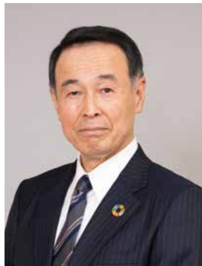
独立行政法人 中小企業基盤整備機構

中小機構の役割は、「中小企業や地域社会の皆様により多彩なサービスを提供することを通じ、豊かでうるおいのある日本をつくる」ことです。今後も中小企業・小規模事業者、さらには日本経済の発展に寄与すべく、役職員が一丸となって全力を尽くしてまいります。