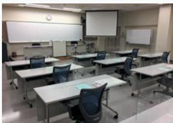
● 教室 大教室(50名) 中教室(30名)