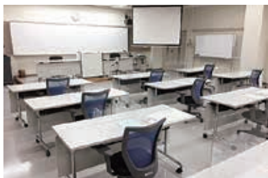
● 教室 大教室(24名) 中教室(20名)