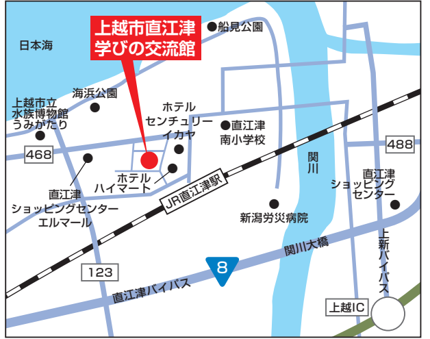
上越市中央一丁目3番18号（直江津図書館）