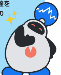
協会オリジナルキャラクター「トミマル」

富山県信用保証協会は、県内中小企業の資金調達を支える公的な保証機関です。多様な保証制度により、企業の成長段階や状況に応じた資金調達をサポートするとともに、近年では従来の信用保証にとどまらず、経営相談や専門家派遣などの経営支援にも力を入れています。事業者一社一社の課題に寄り添いながら、持続的な成長と地域経済の活性化を後押ししています。