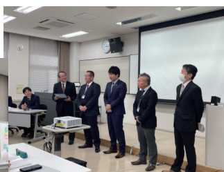
発表会当日の様子