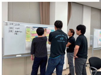
グループワークの様子