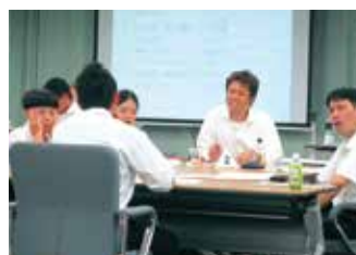
会社を超えて、同じ立場同士、悩みを聞き合う