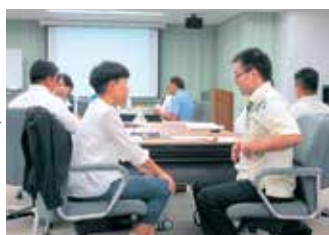
人を動かすコミュニケーション