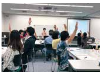
自分の立ち位置をつかむ