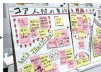
組織を元気にする部下育成をグループで検討