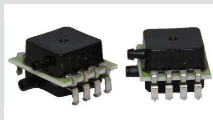
ミニチュアアンプ内蔵出力 MAMP シリーズ