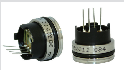
セラミック製 フラッシュマウント圧力センサー