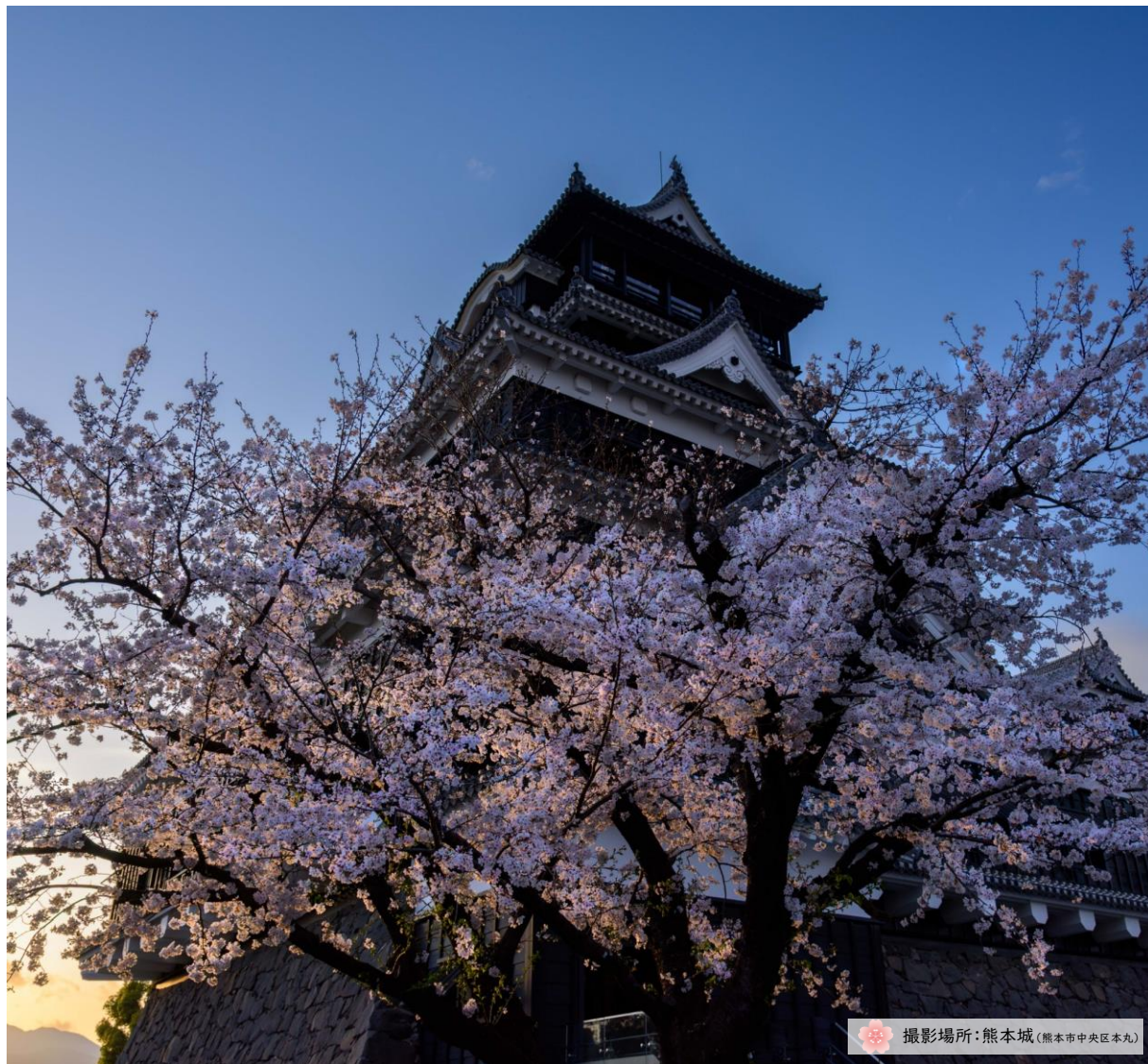
撮影場所:熊本城(熊本市中心区本丸)