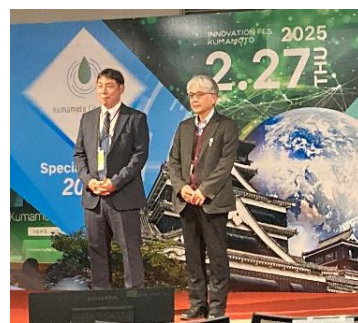
Innovation Fes. Kumamoto