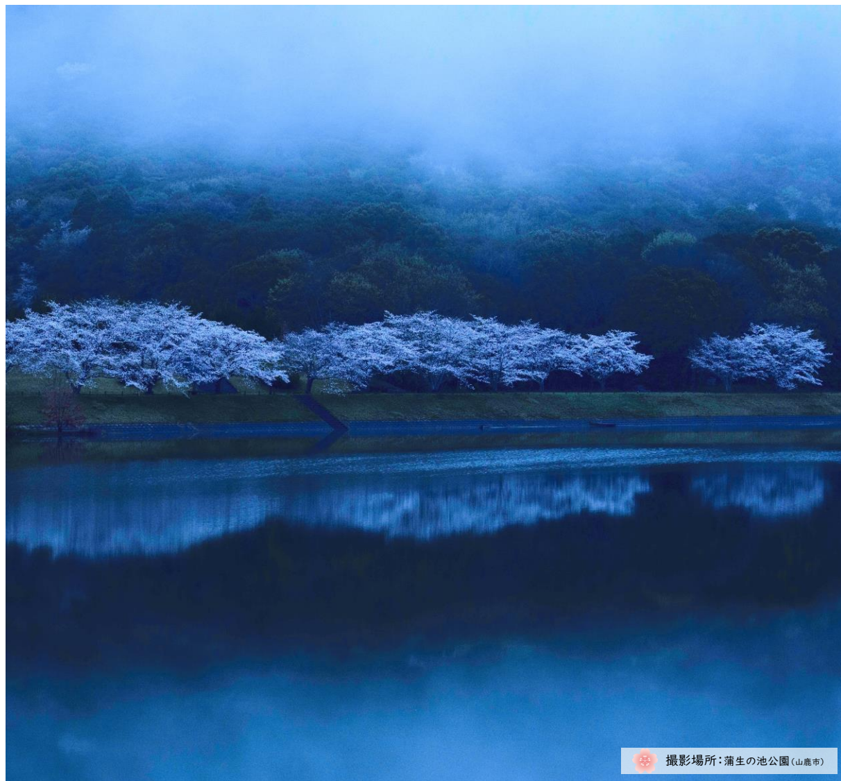
撮影場所：蒲生の池公園（山鹿市）