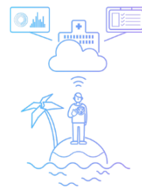
03: 遠隔医療への 取り組み