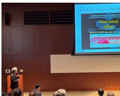
第6回 京都大学ライフサイエンスショーケース @SanDiego2025