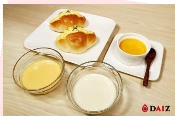
卵と混ぜ合わせた「ハイブリッド液卵」(左)と ミラクルエッグ(右)