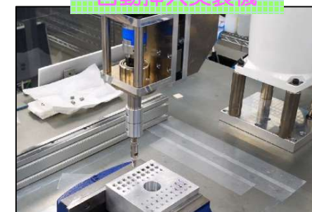
ヘリサートネジ 自動挿入実装機

【会社名】 フォースウェーブ・パートナーズ株式会社 ◆HP: http://www.the4th-wave.co.jp/