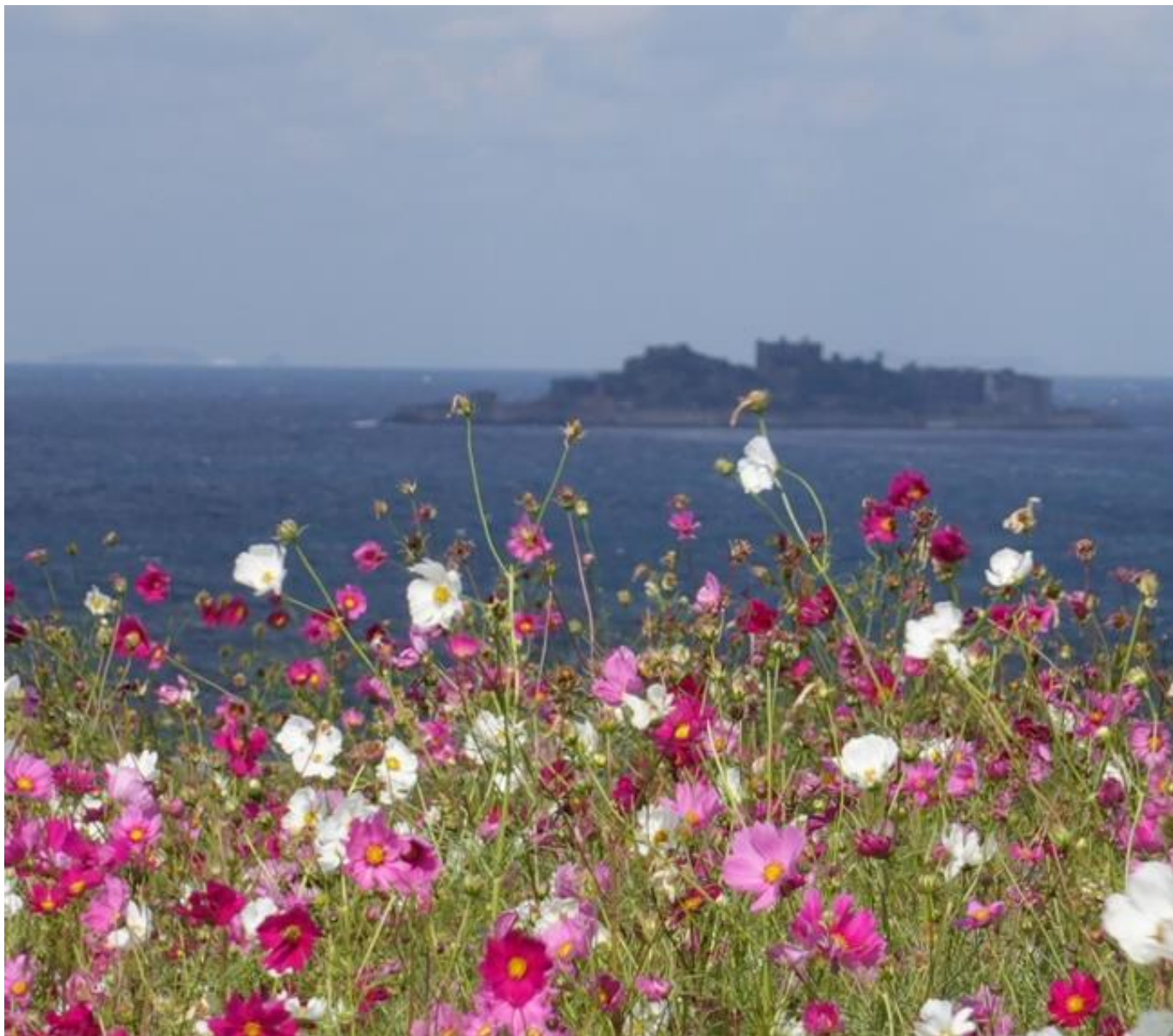
人気ドラマを再現したコスモス畑（野母崎）