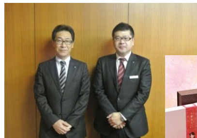
小樽商工会議所・野田事務局長（左）と山崎経営指導員（右）