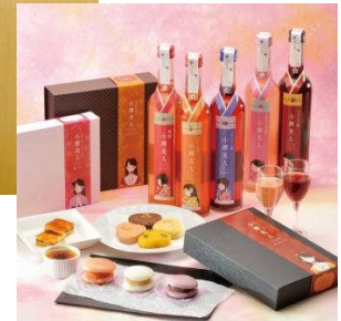
小樽美人シリーズ（リキュール、カタラーナ、蒸しどら、ブラウニー）