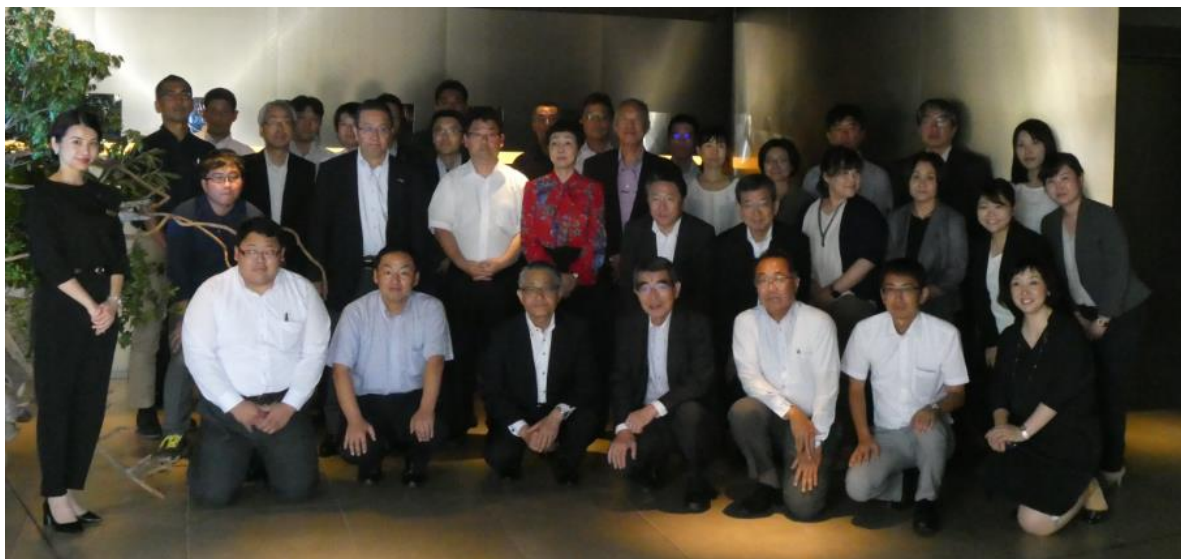
社員さんと参加者の記念撮影