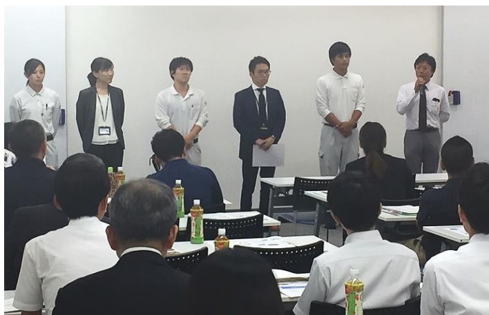
社員さんとのディスカッション