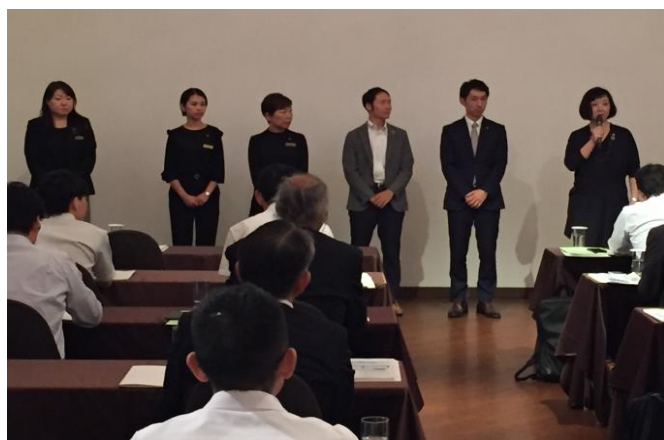
社員さんとのディスカッション