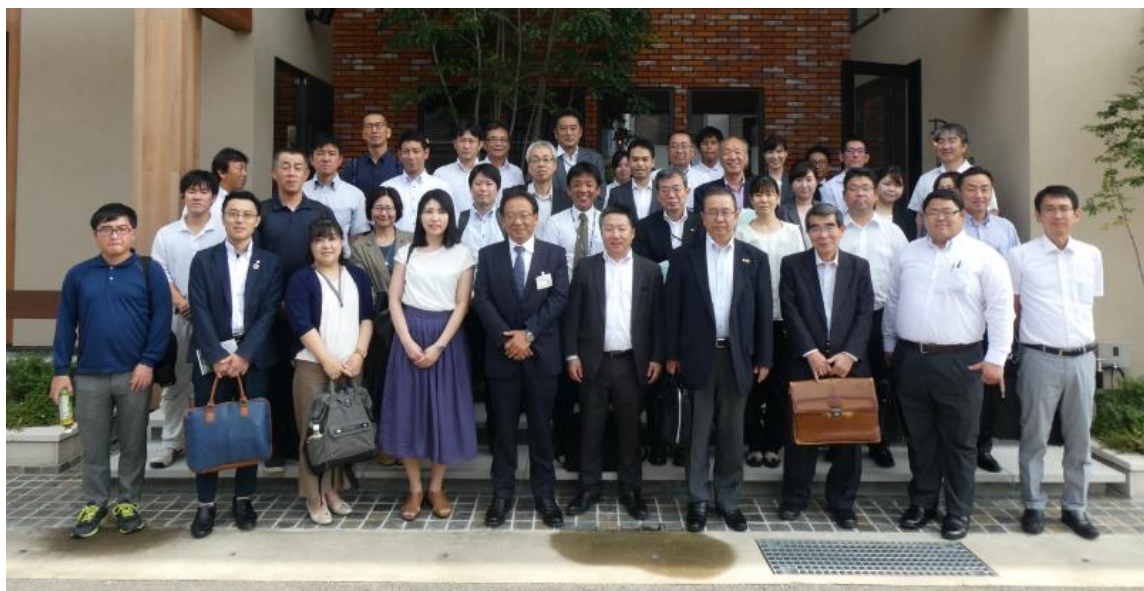
社員さんと参加者の記念撮影