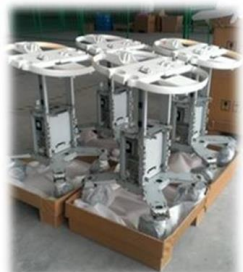
超音波診断装置の組立

Alliance Contract Manufacturing Sdn Bhd ("ACM")