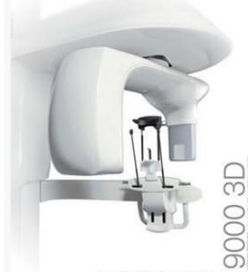
デジタルX線画像診断機器