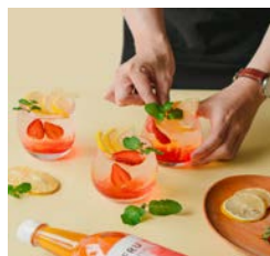
多様なレシピに対応