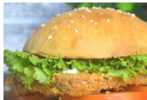
当社製品使用のバーガー