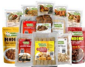
製品ラインナップ