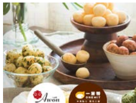
バラエティーに富んだ米菓