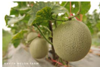
ナビタ メロン ファーム

|参加予定者| ウィッチャヤ・トライチョック |役職| 研究開発マネージャー |本社| バンコク |HP| http://www.navitafarm.com/