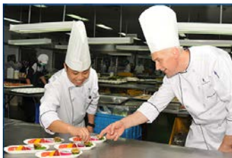
本格的な料理は高い評価を得ている