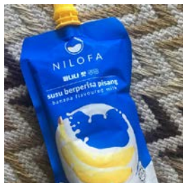
人気のバナナ味ミルク