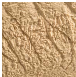
花粉エキスパウダー