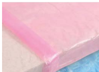
主力製品の魚すり身