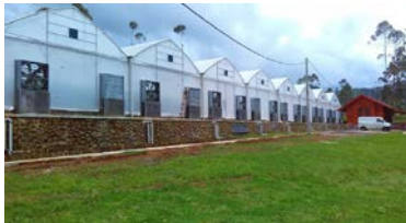
スマート農業（温室ハウス）