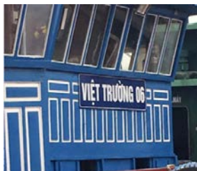
北部漁港ハイフォン市