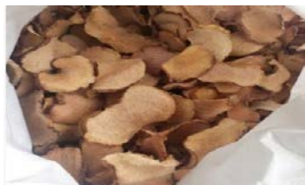
こんにゃくチップ