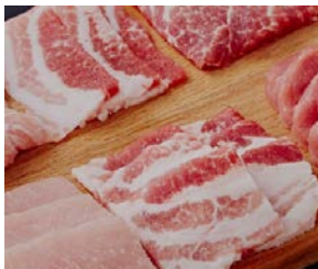
バークシャ黒豚肉