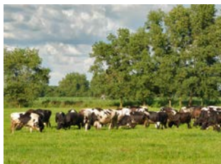
オーストラリア産の乳牛

Dairy Cattle Company of Ho Chi Minh city