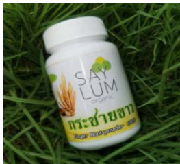
有機野菜健康食品