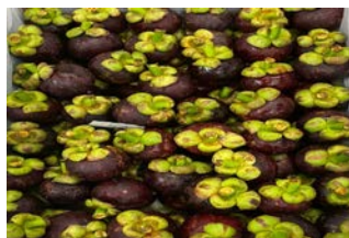
主力のマングスティン