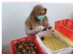
検査装置を導入したい