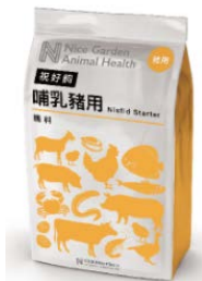
家畜用飼料添加物