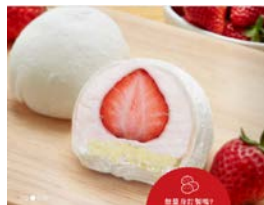
イチゴ入りの大福