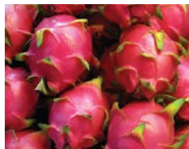
ドラゴンフルーツも人気