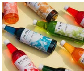
カラフルなデザイン