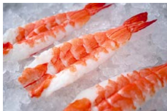
新鮮なバナメイエビ