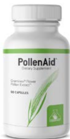
花粉エキス完成品