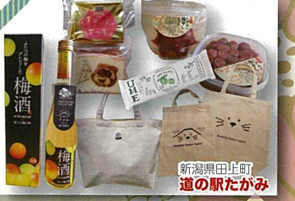
新潟県上田町 道の駅たがみ

瀬戸内しまなみ海道の四国側の起点にある今治市。そこにある22年目の道の駅です。瀬戸内の鯛を使った独自の万能たしつゆ。そして瀬戸内の美味しさをたつぷりお届けしに参りました。