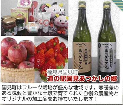
福島県国見町 道の駅国見あつかしの郷

国見町はフルーツ栽培が盛んな地域です。寒暖差のある気候と豊かな土壌で育てられた自慢の農産物とオリジナルの加工品をお持ちいたします！