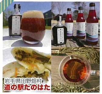
岩手県田野畑村 道の駅たのはた

岩手県北三陸の田野畑村です。荒波でもまれた「若布商品」とやませで育まれた「しいたけ」と和製ハーブと言われる「黒文字商品」をご用意いたしました。一度食べたら、癖になる味が北三陸です。どうぞ「美味」ください。