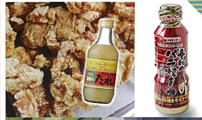
青森県十和田市 道の駅どはだ

岩手県北三陸の田野畑村です。荒波でもまれた「若布商品」とやませで育まれた「しいたけ」と和製ハーブと言われる「黒文字商品」をご用意いたしました。一度食べたら、癖になる味が北三陸です。どうぞ「美味」ください。