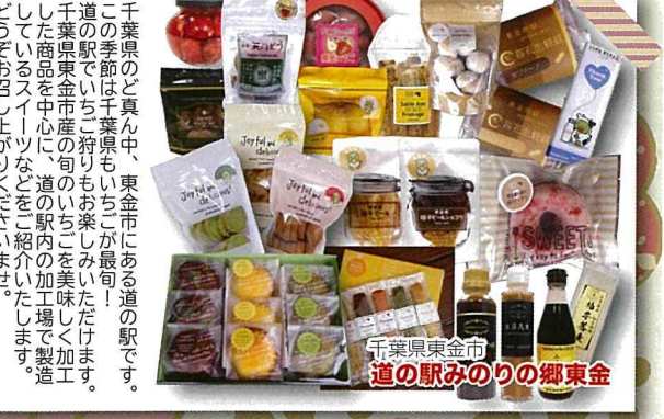
千葉県東金市 道の駅みのりの郷東金

千葉県のご真ん中、東金市にある道の駅です。この季節は千葉県もいちごが最旬！道の駅ではいちご狩りもお楽しみいただけます。千葉県東金市産の旬のいちごを美味しく加工した商品を中心に、道の駅内の加工場で製造した商品などをご紹介します。どうぞお召し上がりください。