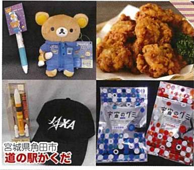
宮城県仙台市 道の駅かくだ

河北新報ネットニュースで、ちよっと立ち寄りたい！宮城「道の駅」第2位に選ばれました。道の駅かくだ選りすぐりの商品をお持ちしました。ちよっと珍しいJAXAマークの商品もございます。ちよっとのぞいてみてください。皆様のお越しをお待ちしております。