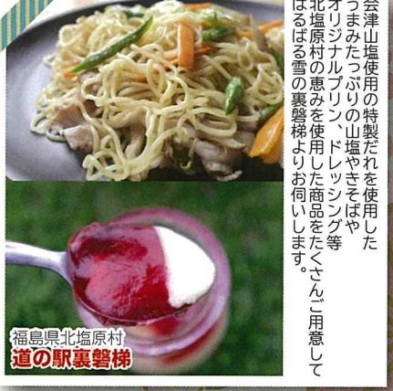
福島県北塩原村 道の駅裏磐梯

国見町はフルーツ栽培が盛んな地域です。寒暖差のある気候と豊かな土壌で育てられた自慢の農産物とオリジナルの加工品をお持ちいたします！