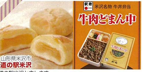
山形県米沢市 道の駅米沢

陸前高田から来ました、道の駅高田松原です！2種類のオリジナルカレーや、大人気の「マスカットサイダー」「米崎りんごサイダー」等、陸前高田らしさのある商品を沢山ご用意しております。中には道の駅高田松原でしか買えないものも・・・。