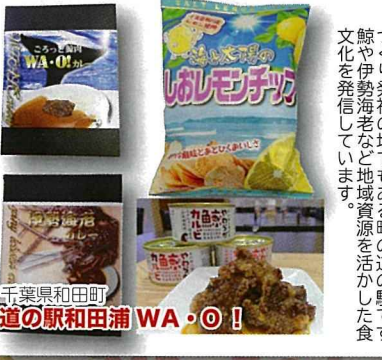
千葉県和田町 道の駅和田浦 WA・O!

千葉県のご真ん中、東金市にある道の駅です。この季節は千葉県もいちごが最旬！道の駅ではいちご狩りもお楽しみいただけます。千葉県東金市産の旬のいちごを美味しく加工した商品を中心に、道の駅内の加工場で製造した商品などをご紹介します。どうぞお召し上がりください。