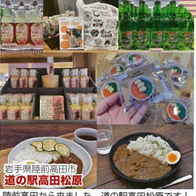
岩手県陸前高田市 道の駅高田松原

陸前高田から来ました、道の駅高田松原です！2種類のオリジナルカレーや、大人気の「マスカットサイダー」「米崎りんごサイダー」等、陸前高田らしさのある商品を沢山ご用意しております。中には道の駅高田松原でしか買えないものも・・・。