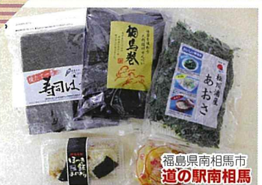
福島県南相馬市 道の駅南相馬