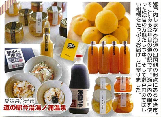
愛媛県今治市 道の駅今治湯ノ浦温泉

奥会津の山から海にきました！太平洋より日本海の方が近いです(;'▽')山の幸や村人手作りのお菓子など、昭和村でしか買えないものが並ぶので是非遊びに来てください！日本の「かすみそう」と、日本の伝統工芸品「からむし織」も少しだけですが持って行きます。