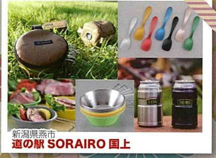
新潟県燕市 道の駅 SORAIRO 国上

千葉南房総で捕鯨基地があり、房総の花づくり発祥の地でもある町の道の駅です。鯨や伊勢海老など地域資源を活かした食文化を発信しています。