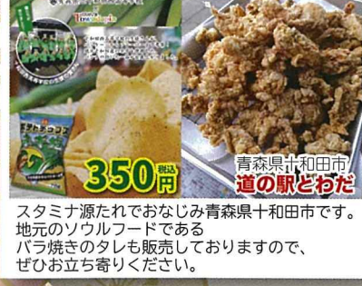
スタミナ源たれでおなじみ青森県十和田市です。地元のソウルフードであるバラ焼きのたれも販売しておりますので、ぜひお立ち寄りください。