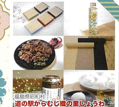
福島県昭和村 道の駅からむし織の里しょうわ

会津山塩使用の特製たれを使用したオリジナルの山塩やきそばやオリジナルプリン、ドレッシング等は北塩原村の恵みを使用した商品をとくさんご用意してはるばる雪の裏磐梯よりお伺いします。