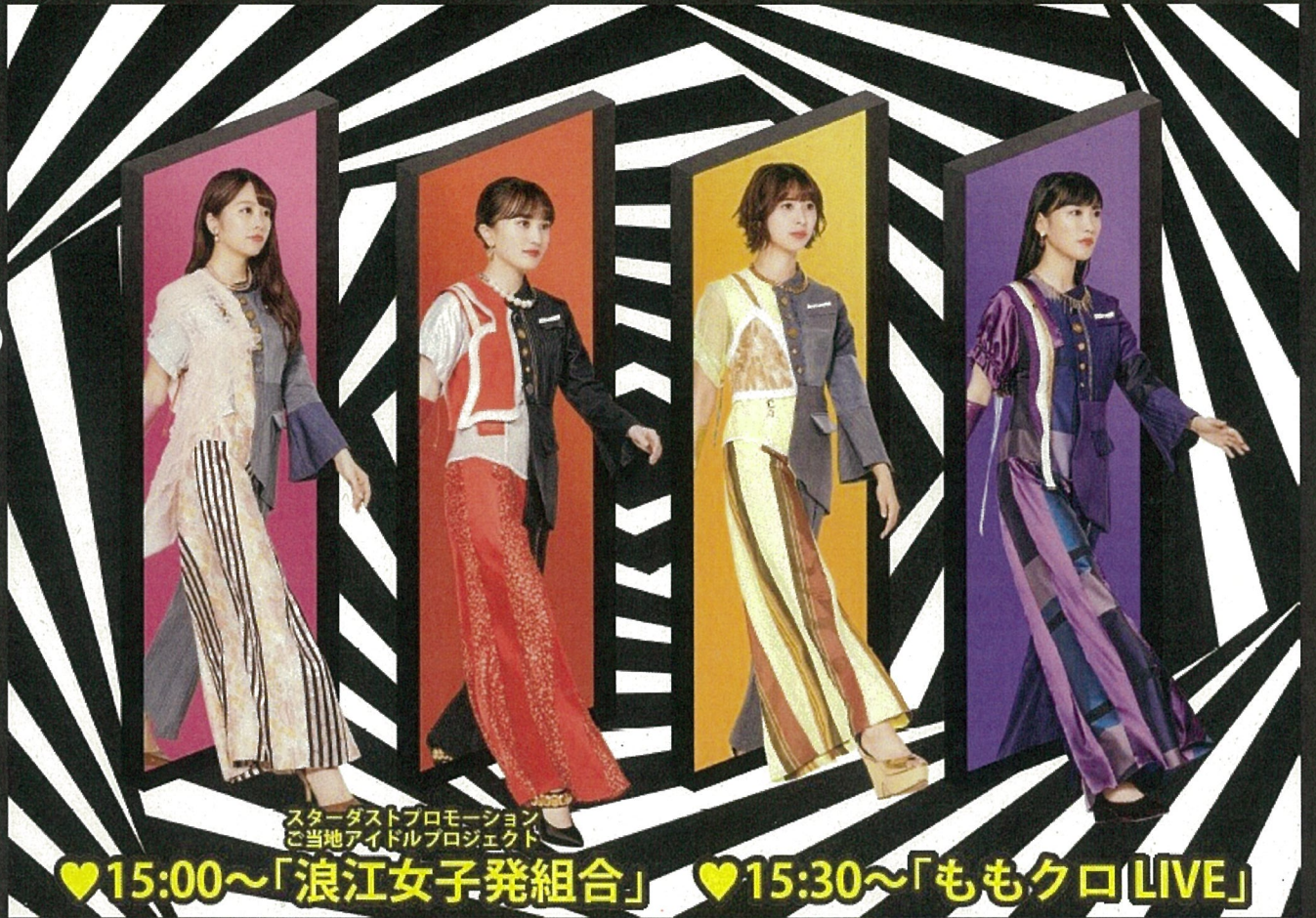
スターダストプロモーション ご当地アイドルプロジェクト

会場の整いを迎えるため観覧エリアへのご入場は、観覧券をお持ちの方のみとさせていただきます。