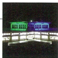
写真はイメージです。