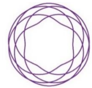
地域未来牽引企業

地域内外の取引実態や雇用・売上高を勘案し、地域経済への影響力が大きく、成長性が見込まれるとともに、地域経済のバリューチェーンの中心的な担い手、および担い手候補である企業を「地域未来牽引企業」として経済産業省が選定。（全国4,730者、近畿管内798者）