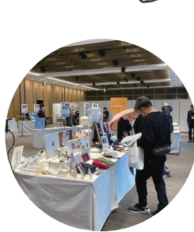
ヒットをねえ！地域のおすすめセレクション2023（前回）開催の様子