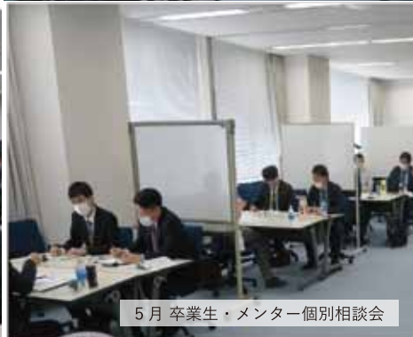
5月 卒業生・メンター個別相談会