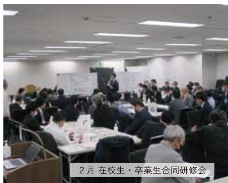
2月 在校生・卒業生合同研修会