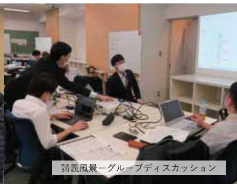
講義風景－グループディスカッション