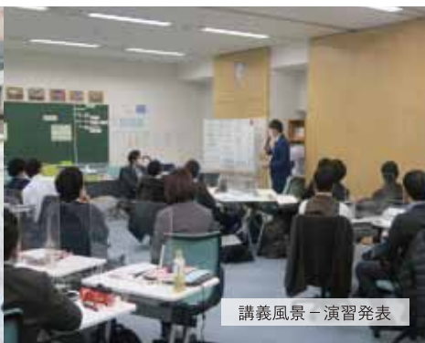
講義風景－演習発表