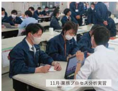
11月 業務プロセス分析実習