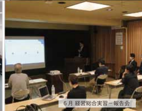
6月 経営総合実習－報告会