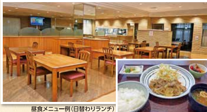
屋食メニュー例(日替わりランチ)