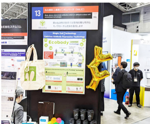
iBody (株) 展示ブース