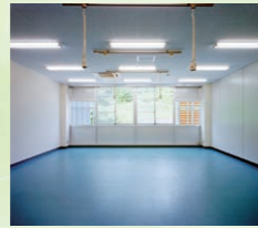
実験室・研究室(北館)