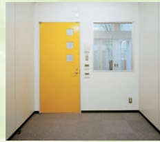
スモールオフィスタイプ(北館)