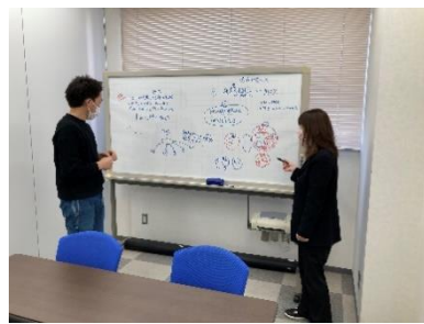
※実際のカベウチの様子