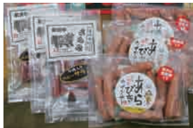
写真左側 米沢牛入りサラミソーセージ 写真右側 リオナソーセージ (オニオン入り)