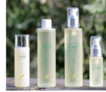
農業法人有限会社 井上誠耕園 美容オリーブオイル