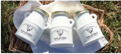
株式会社オオヤブデイリーファーム エイジングヨーグルト