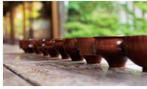
株式会社我戸幹男商店 山中漆器