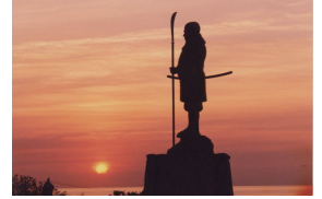
北海道寿都町 弁慶岬と夕日