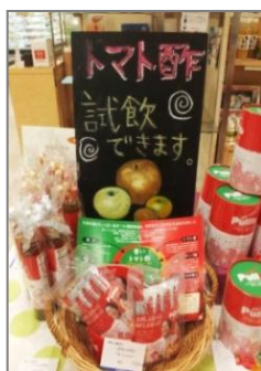
↑常設販売スペース