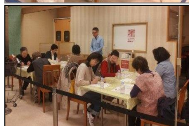
←ワークショップの様子