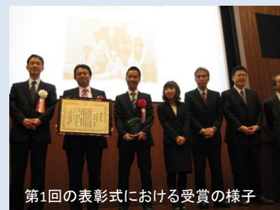
第1回の表彰式における受賞の様子