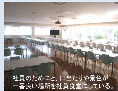
社員のために、日当たりや景色が一番良い場所を社員食堂にしている。