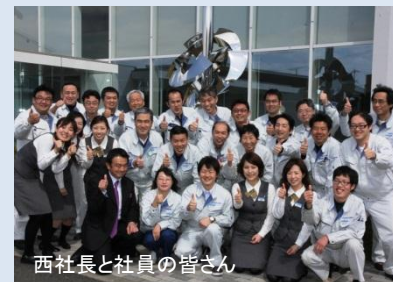
西社長と社員の皆さん