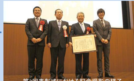
第3回表彰式における記念撮影の様子