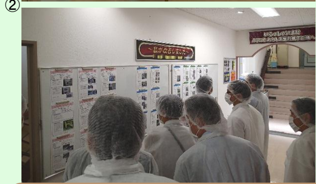
前回の“いい会社づくり”勉強会の様子 (訪問先:株式会社あわしま堂(愛媛県八幡浜市)) ①社員へのインタビュー ②社内の見学