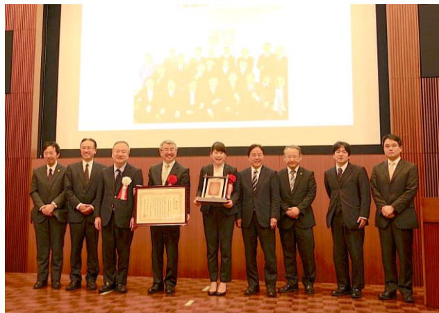
四国経済産業局長賞 株ありがとうサービス殿