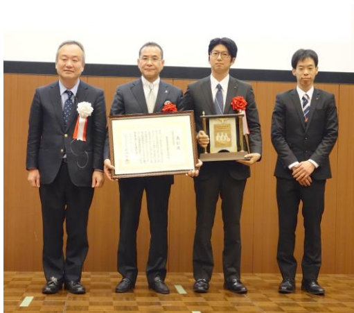
産業振興貢献賞 山本貴金属地金(株) 殿