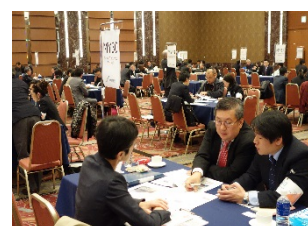
上：マレーシアCEO商談会（平成28年3月開催）

この事業はASEAN医療機器企業と日本のものづくり企業の経営者レベルでのネットワーク構築を主眼としており、海外企業から経営者を招聘するのが最大の特徴です。ASEAN市場での本格的な展開を見据えた商品の共同開発、合併事業、ASEAN市場向け販売代理店契約などの長期的な「ビジネス・パートナー」の発掘を目的としています。