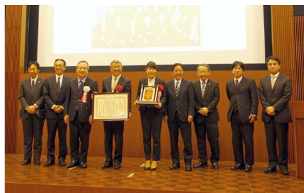
四国でいちばん大切にしたい会社大賞 四国経済産業局長賞(昨年度) ありがとうサービス 様(今治市)