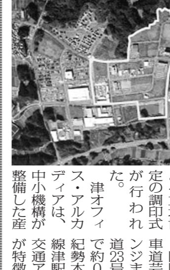
津オフィス・アルカディアの地図

津オフィス・アルカディア 契約の締結および土地約30畝で、このうち分譲対象面積は25畝52区画。9月7日に中小機。また、同月29日に画。平成13年4月から、津市役 分譲を開始し、これまで17社38区画が分譲。津オフィス・アルカディアは、線津駅まで約7分、交通アクセスが非常に良いのが特徴である。