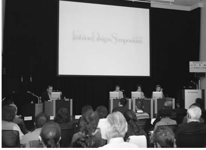
海外有名校教授招きシンポジウム。東京経済大学が主催し、海外有名校の教授を招き、日本のフロンティア・ビジネスの現状と今後の展望について話し合った。