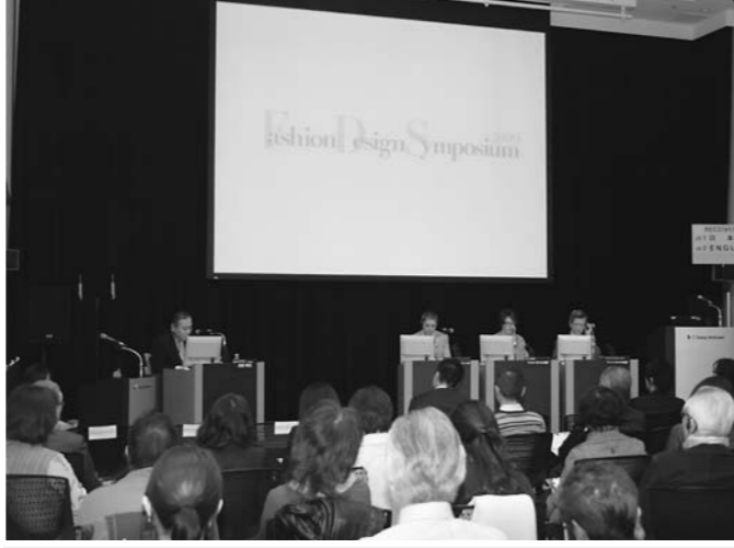
航空機市場参入を支援するシンポジウム。左から、東京経済大学東横キャンパスで開かれたシンポジウムの様子。