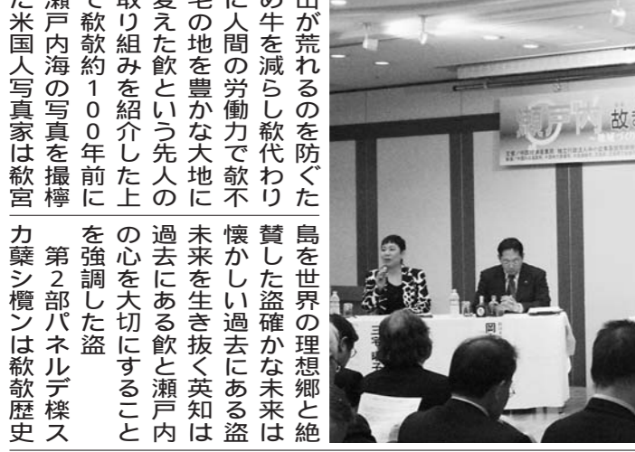
「瀬戸内・故きをたずねて」シンポジウムの様子。

瀬戸内や中国地域の戸内に多数存在する地域資源を活かした振興策を探る。地域資源を活かした振興策を探る。地域資源を活かした振興策を探る。地域資源を活かした振興策を探る。