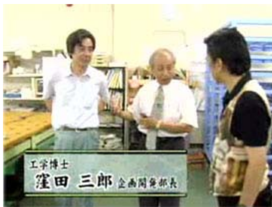
「窪田企画開発部長と上杉社長」