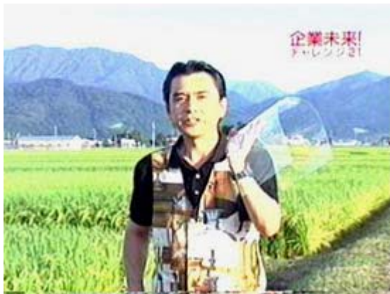
「曲げガラスを手に」