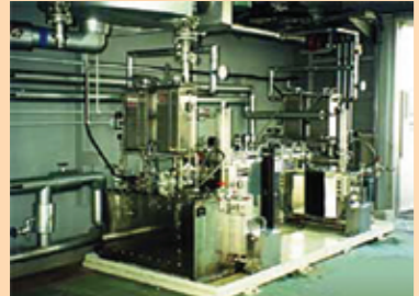
溶剤真空回収装置

平成18年4月から実施されたVOC規制によって各方面から引き合いがある。主な納入先としては、トヨタ自動車、福助工業、ニチアス、寺岡製作所、田中貴金属工業、富士インキ工業、ダイニック、スリーポンド化成、日東電工、クレハ、三菱レーヨンエンジニアリングなどである。